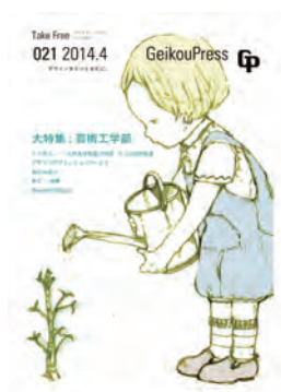
芸工プレス第 021 号 大特集：芸術工学部 芸工の住人