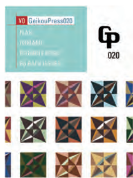
Gp020 20号記念号 長崎の情報誌 [Flag] 折り紙