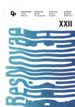
GpXXII 小倉織 明朝体